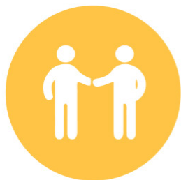
Respecter les attentes de tou.te.s nos bénéficiaires