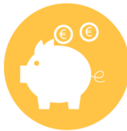
Respecter l'équilibre économique