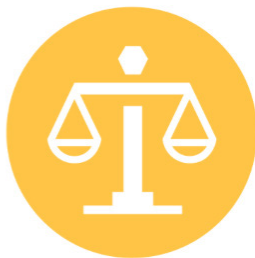
Respecter la loi et droit du Travail