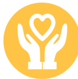
Etre bienveillant Considérer toutes les personnes et donner du sens aux actions de chacun

Nous sommes persuadés que la valorisation de nos métiers du grand âge et de l'autonomie passent par une professionnalisation de nos équipes et par une reconnaissance économique.